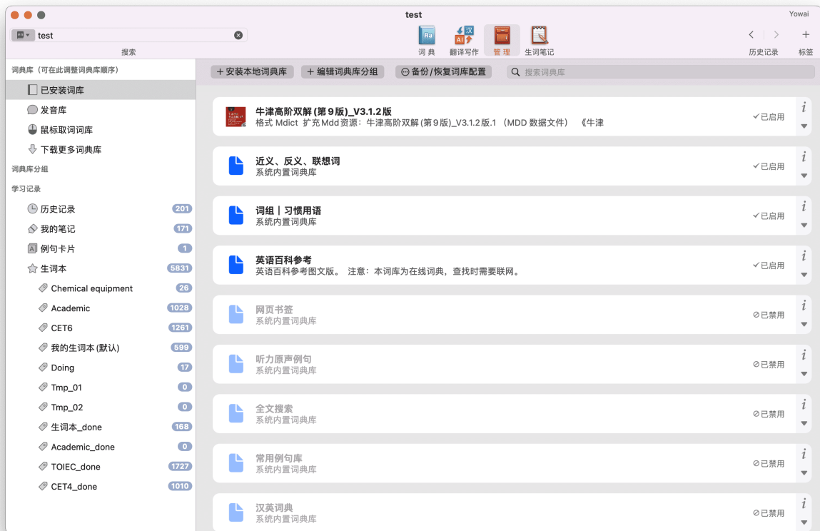
Fig. 3: 单词分类